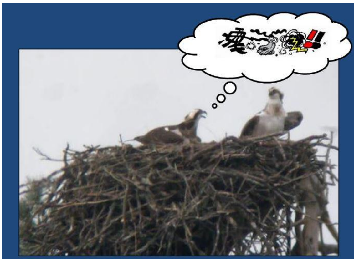
PANCHITA increpando a un macho despistado que intenta ocupar su nido. Imagen de Gilles Perrodin el 15/04/17

Por lo demás, todo prosigue con normalidad en el nido de Panchita... De vez en cuando, algún pobre insensato intenta perturbar su paz. Molestias sin importancia, comparado a los sobresaltos a los que nos tenía acostumbrados en años anteriores