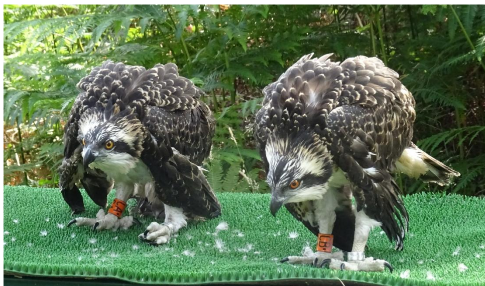
Pie de foto: pollos de PANCHITA fotografiados el día del anillamiento

Un año más (y con este ya son 5), los pollos de nuestra querida PANCHITA han sido anillados por el ornitólogo sueco Rolf Wahl , y por supuesto no hemos querido perdérselo. Por si todavía alguien no lo sabe, PANCHITA es el águila pescadora francesa que pasa los inviernos en la ría del Eo.