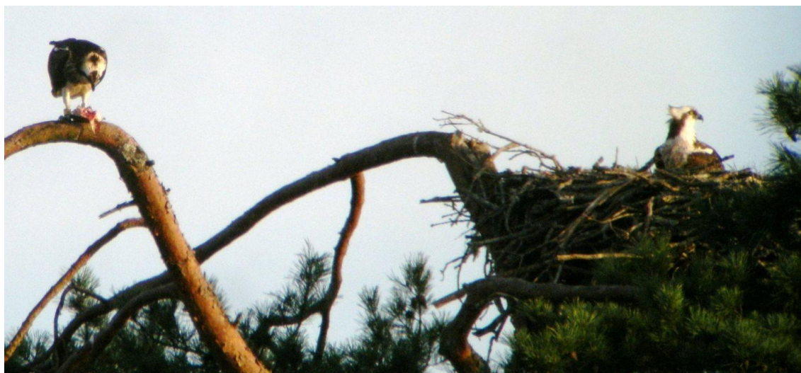
Panchita comiendo, y el macho [8Z], colocando ramas en el nido de Ravoir.

10-MARZO-2017 Panchita reaparece en RAVOIR