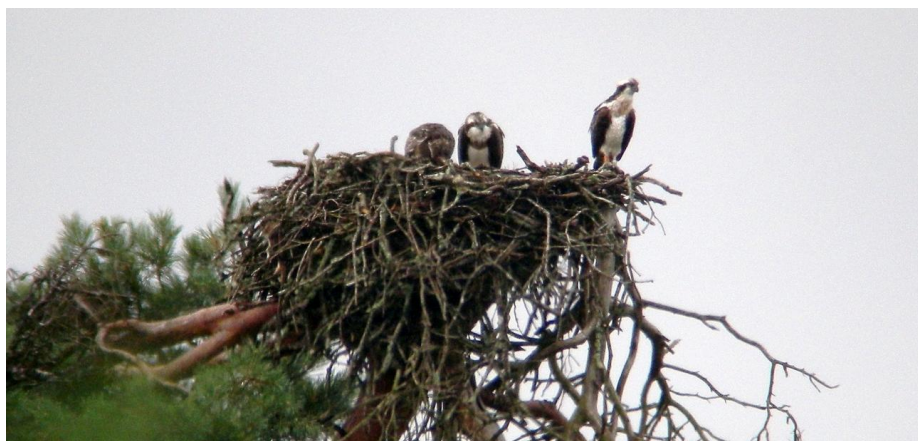
Macho y los dos jóvenes el 24/07/17

Como todos los años, poco a poco van pasando los días, hasta que Panchita deja de verse por la zona de cría.