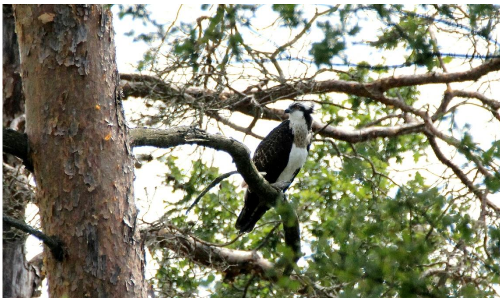
Uno de los jóvenes de Panchita, fotografiado por Gilles Perrodin el 21 de julio en uno de sus posaderos preferido

"El duro aprendizaje": https://vimeo.com/224966099